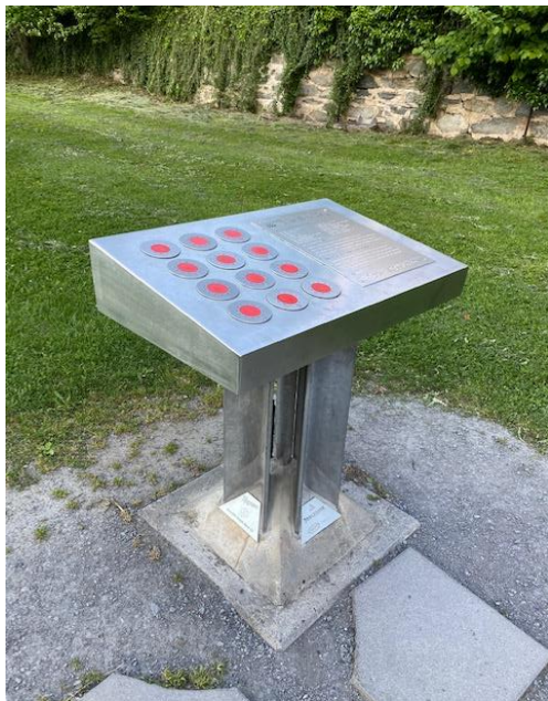
et son tableau de commande