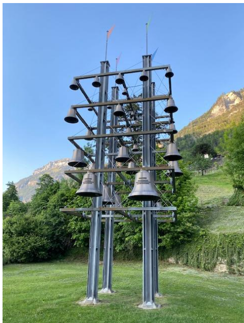
Le carillon de Sisikon...