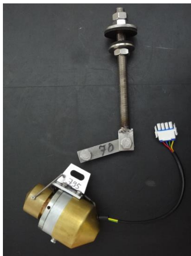
et un marteau