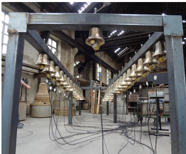
Un carillon électrique ...

Que non. D'autres instruments, l'orgue par exemple ont subi la même dérive. Il y a un monde entre les grandes orgues de la collégiale de Moutier et celles de l'abbatiale de Bellelay.