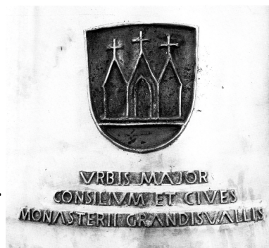
Décor et inscription "Ville de Moutier"

Inscription : O Christ, Roi de gloire, apporte-nous la paix. Saint Germain et Saint Randoald Le maire, son Conseil et les citoyens en Moutier-Grandval Fondue à Aarau par les ouvriers Rüetschi