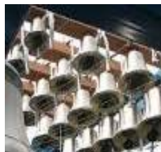
Petites cloches du Carillon