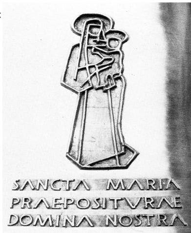
Décor et inscription "Sainte-Vierge"

Inscription : Comme Dieu t'y convie, Pierre, brise nos chaînes terrestres, Toi qui veille à maintenir ouvertes aux bienheureux les portes du Royaume céleste. Alleluia Saint-Pierre apôtre