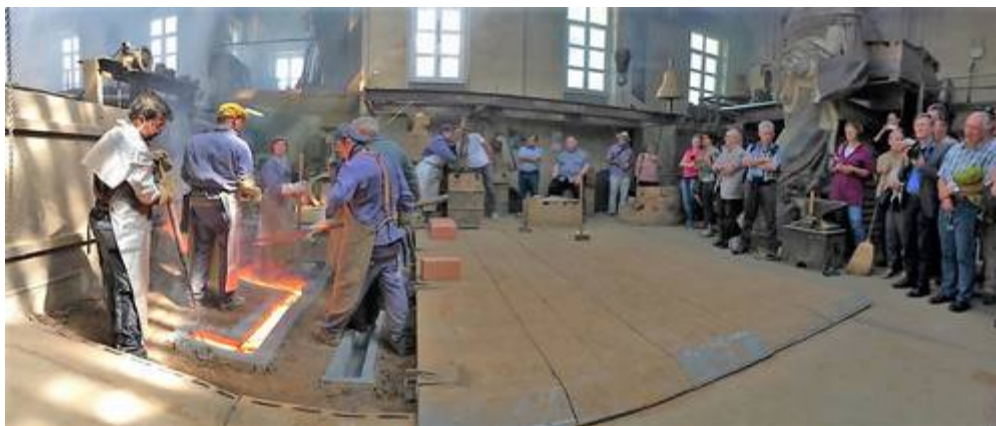
Coulée du Bourdon Sainte-Trinité, Aarau, 24 mai 2018