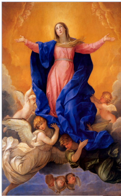
L'Assomption de la Sainte-Vierge

Inscription : Sainte Anne, Mère de Marie, conduis-nous vers Jésus.