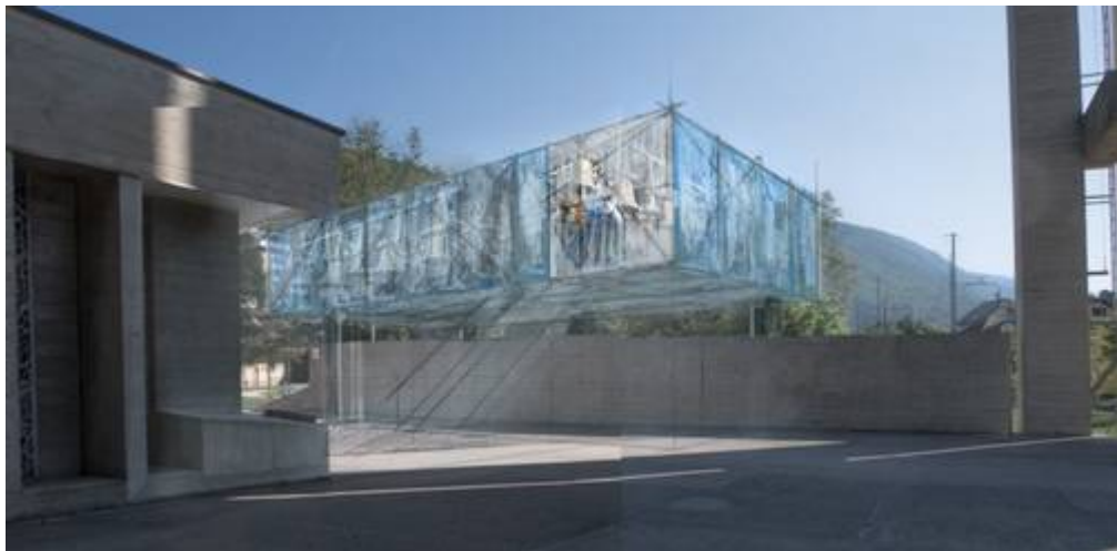
Avant-projet du carillon : vue vers le Levant