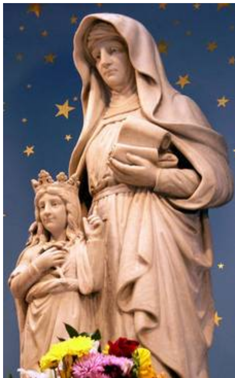
Sainte-Anne et Marie